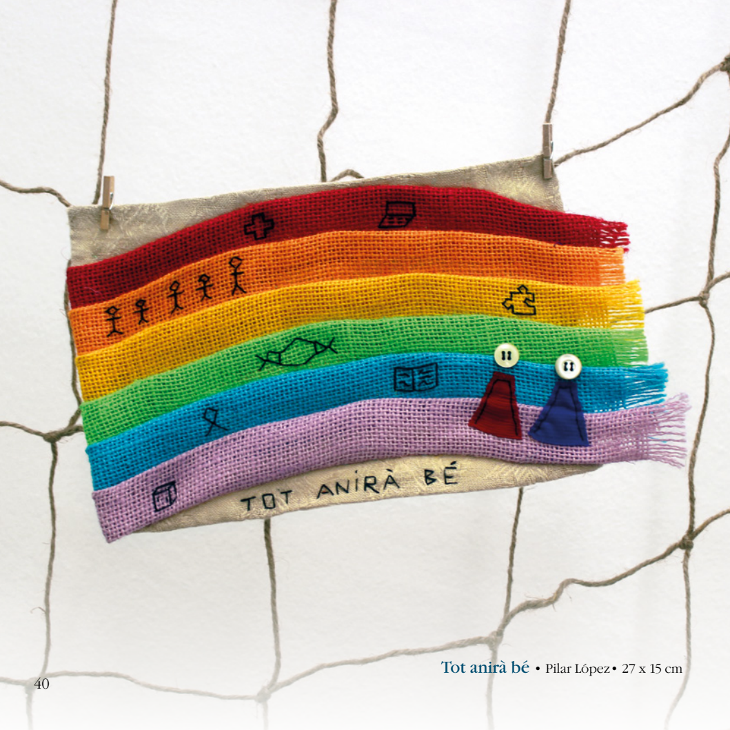
Tot anirà bé • Pilar López • 27 x 15 cm