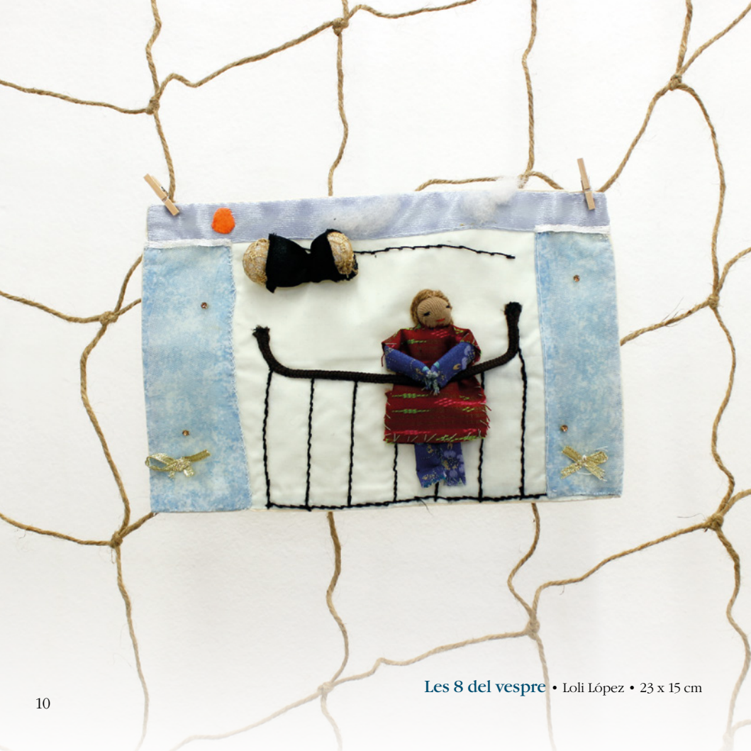
Les 8 del vespre • Loli López • 23 x 15 cm