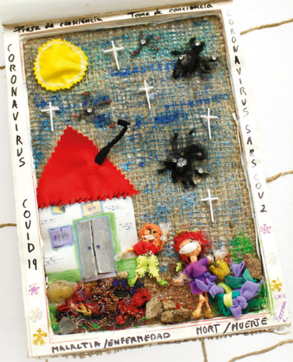
Preses de consciència • Luz Ferran • 17 x 15,5 cm