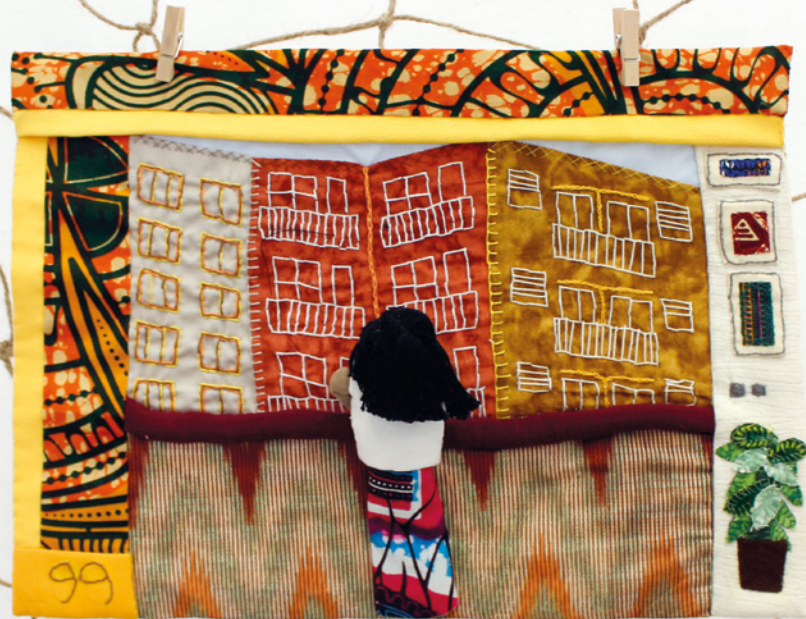
Confinament i pandèmia • Mònica Moro • 34 x 26 cm