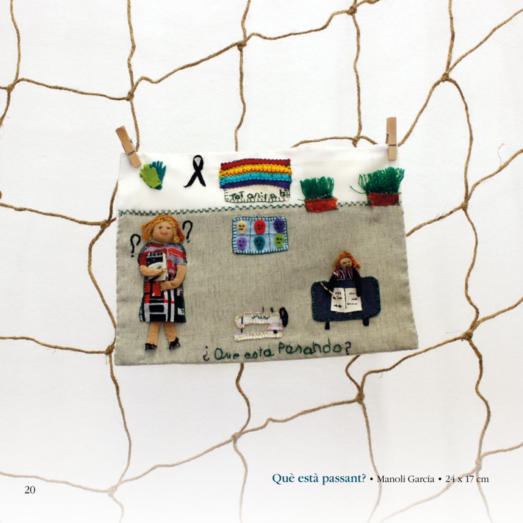
Què està passant? • Manoli García • 24 x 17 cm