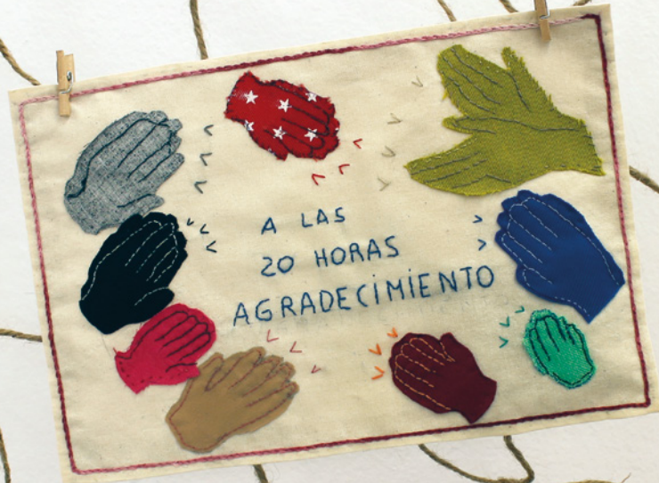
Agraïment • Mercè Monge • 23,5 x 15,5 cm