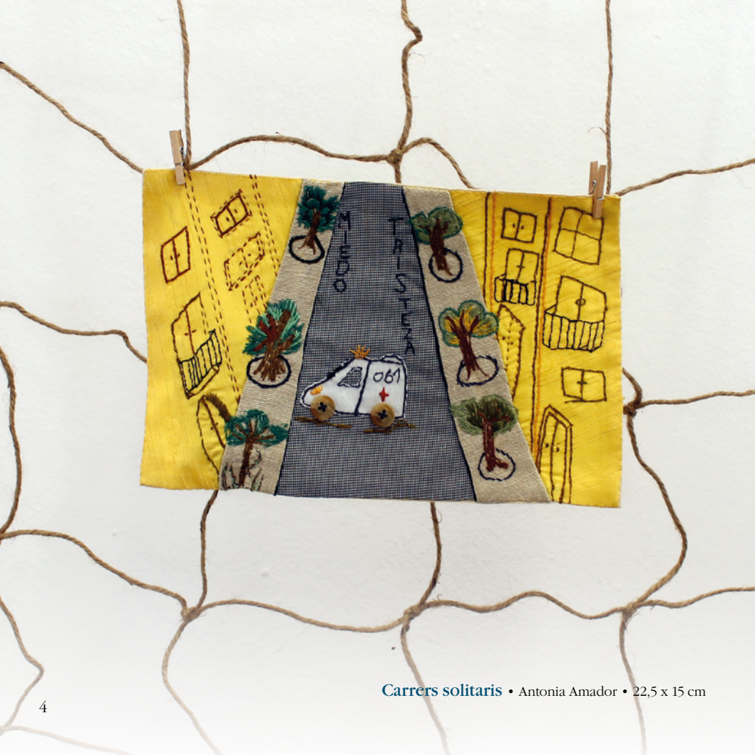
Carrers solitaris • Antonia Amador • 22,5 x 15 cm