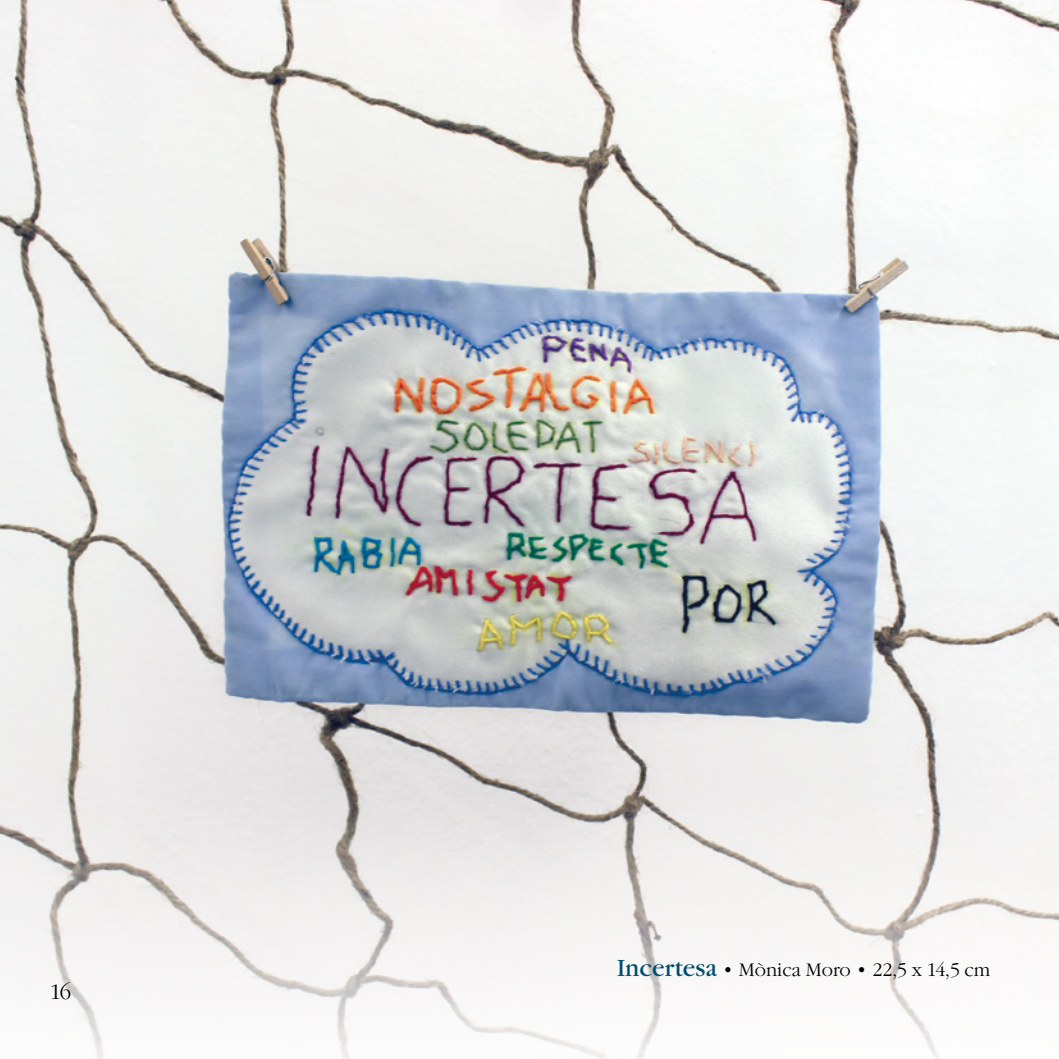
Incertesa • Mònica Moro • 22,5 x 14,5 cm