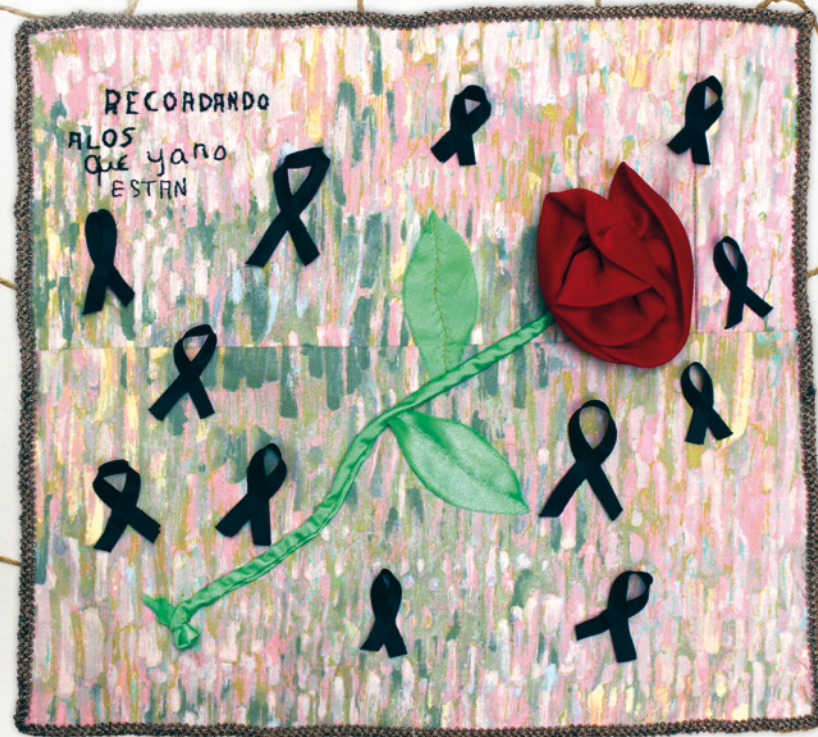
Recordant els que ja no hi són • Antonia Amador • 43 x 40 cm