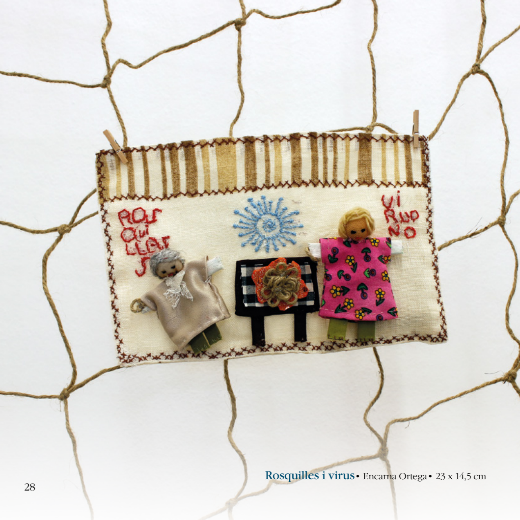
Rosquilles i virus • Encarna Ortega • 23 x 14,5 cm