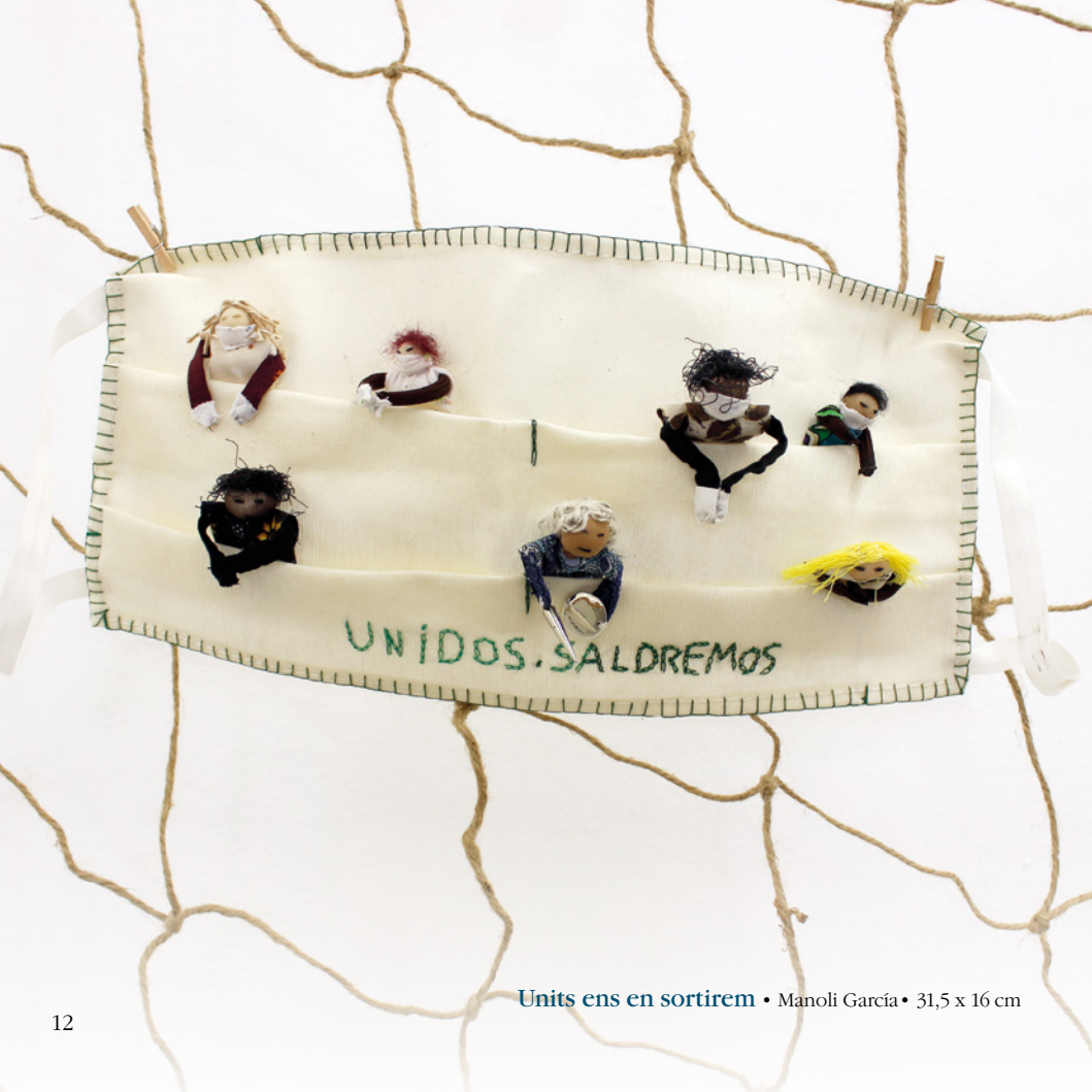
Units ens en sortirem • Manoli García • 31,5 x 16 cm