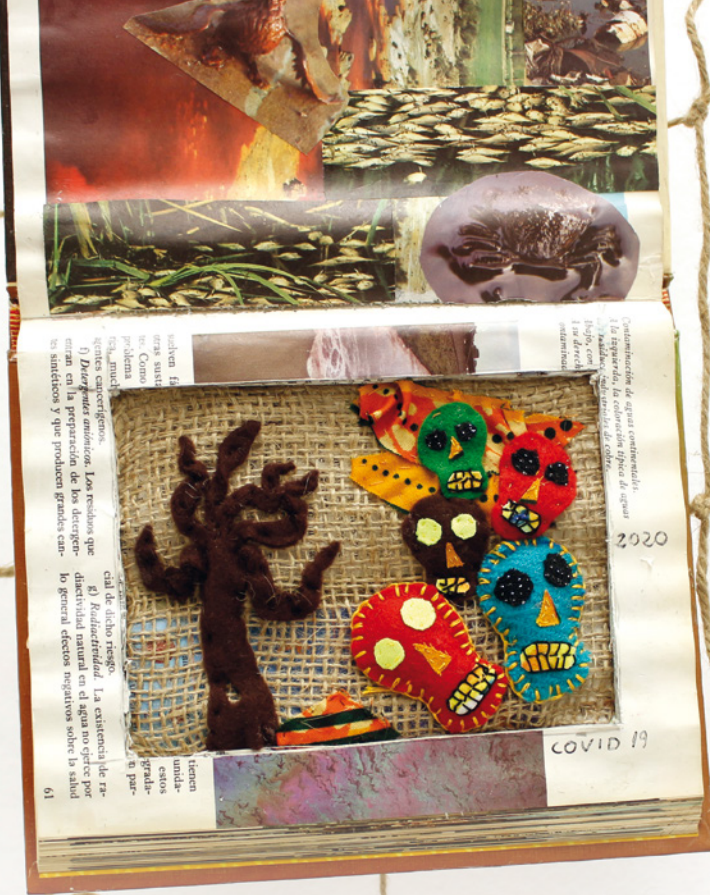
La contaminació i la covid-19 • Lourdes Monitorio • 21 x 26,5 cm