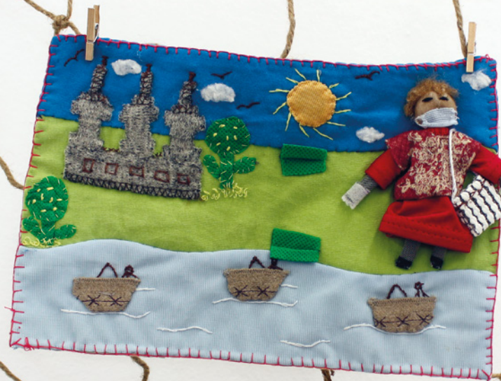
Podem sortir • Paqui Báez • 23 x 15 cm