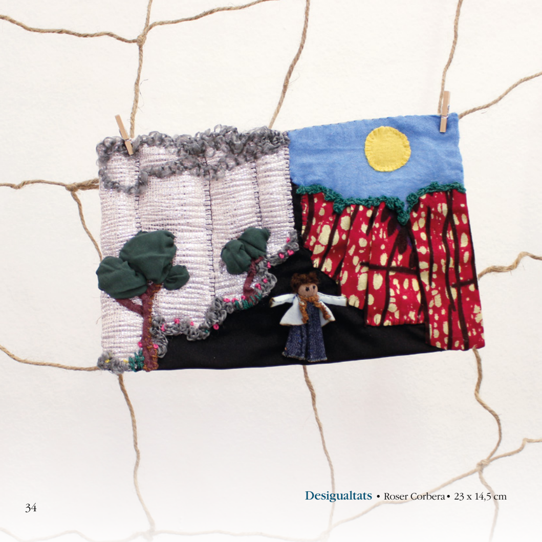
Desigualtats • Roser Corbera • 23 x 14,5 cm