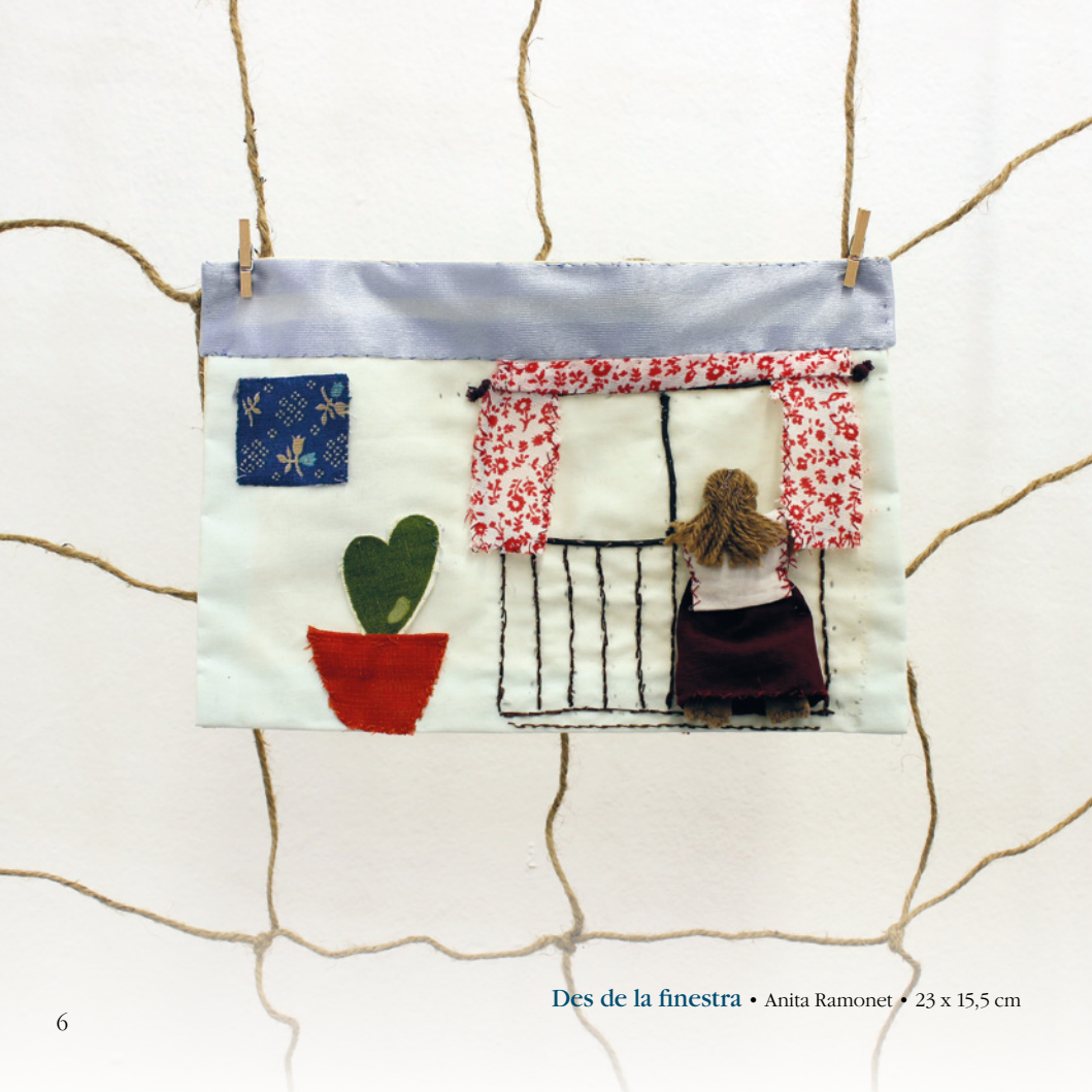
Des de la finestra • Anita Ramonet • 23 x 15,5 cm