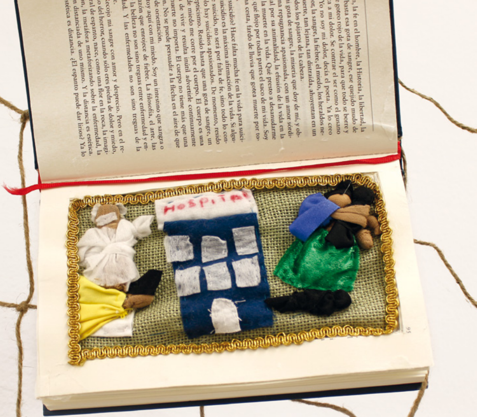
La covid-19 • Luz María Malpartida • 20 x 32 cm