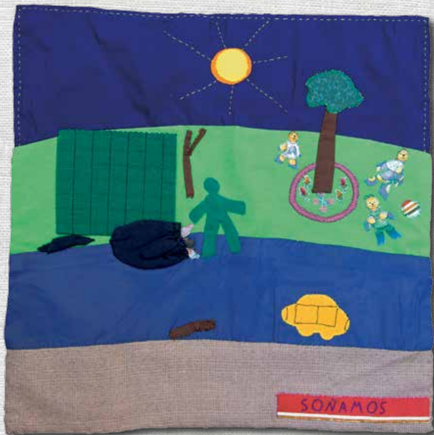
Somien 51 x 48,5 cm