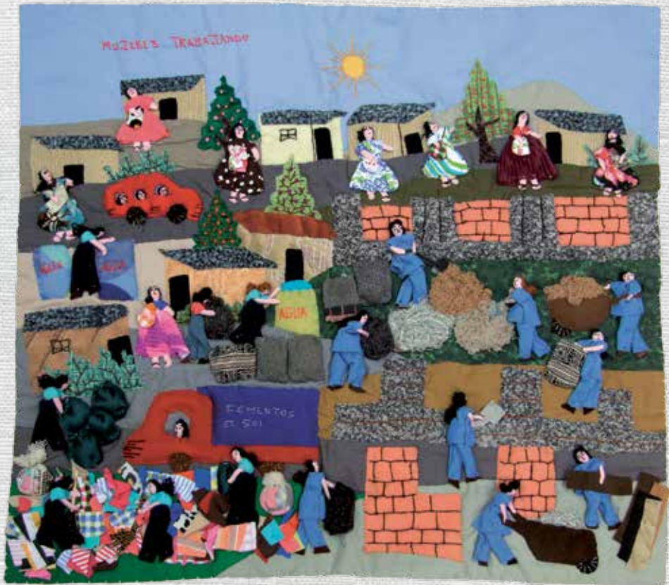
Mujeres trabajando 45 x 49 cm