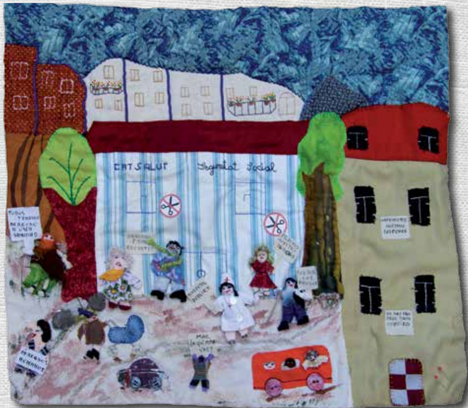
Dret a la sanitat 39 x 46 cm