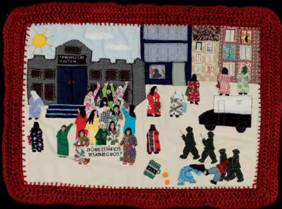
¿Dónde están los desaparecidos? 36 x 48,5 cm