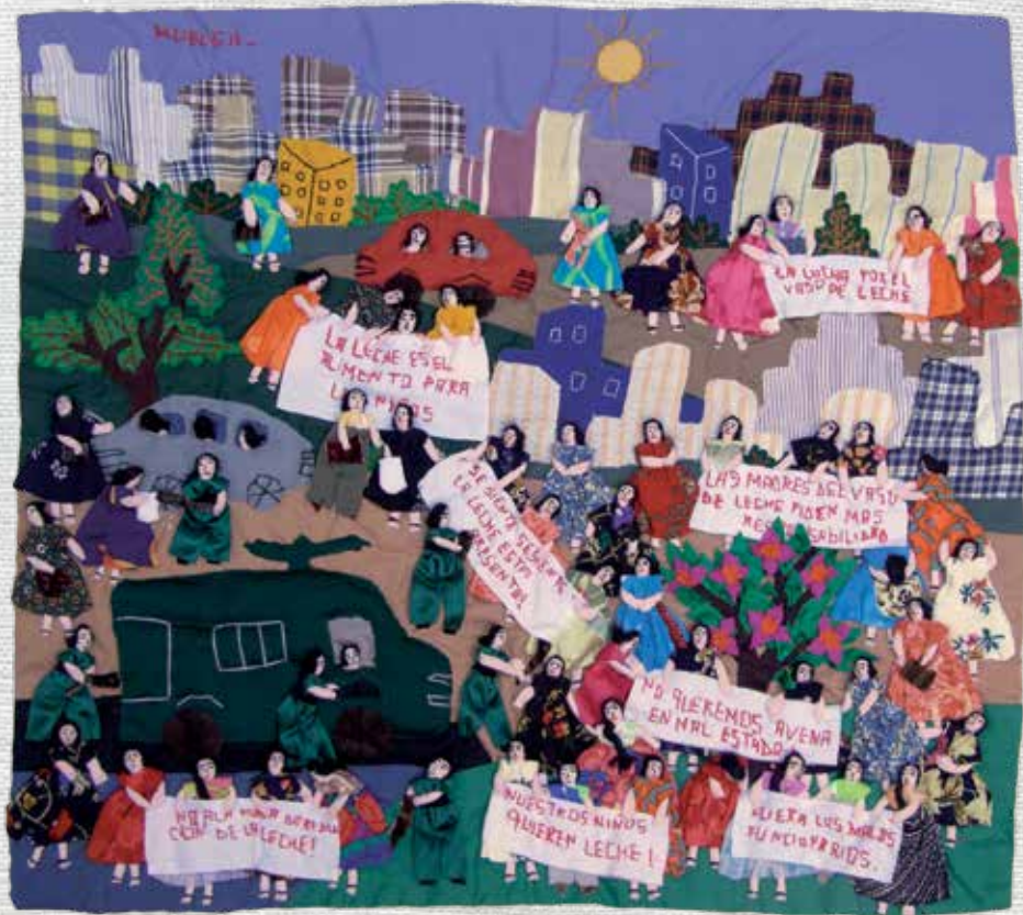
Huelga "Vaso de leche" 45 x 49 cm