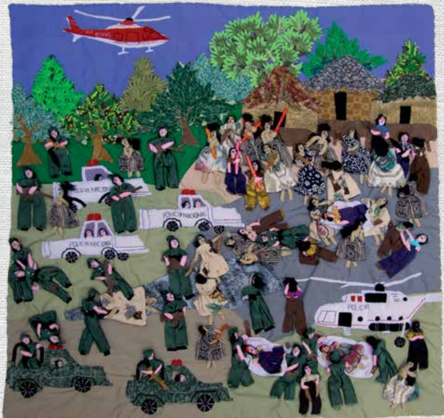
Protesta 50 x 48 cm