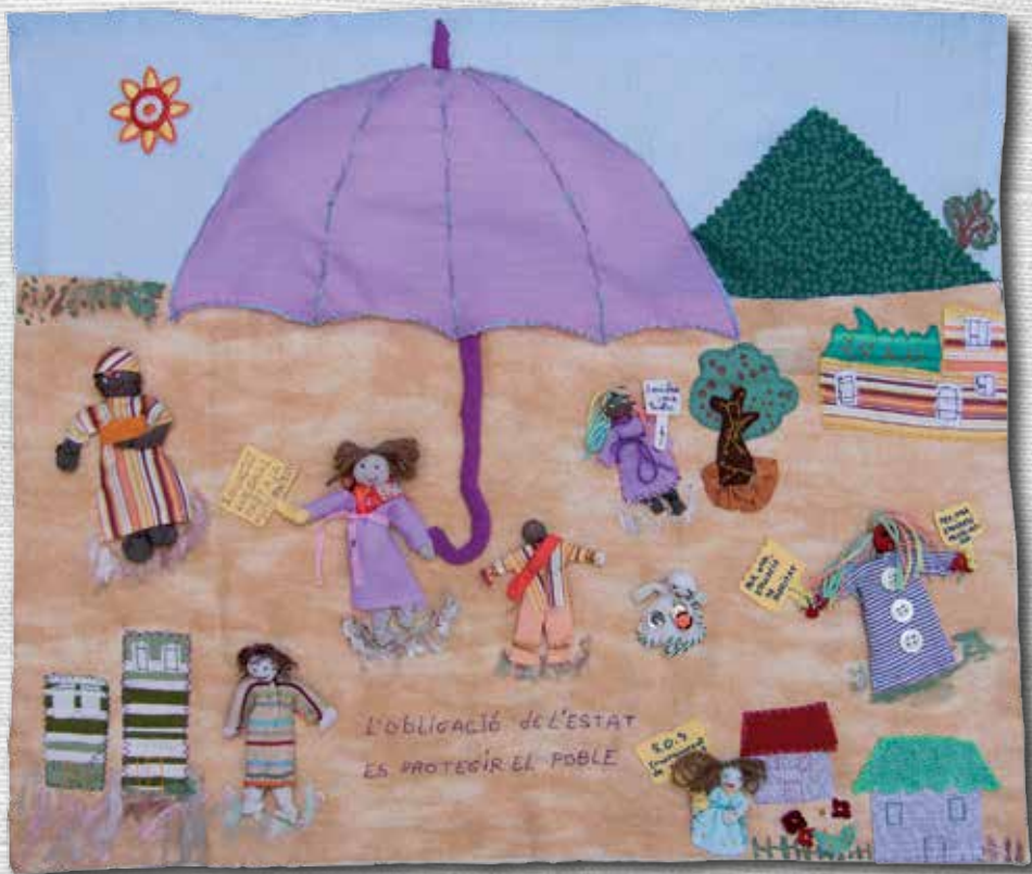
L'obligació de l'Estat 41 x 50 cm