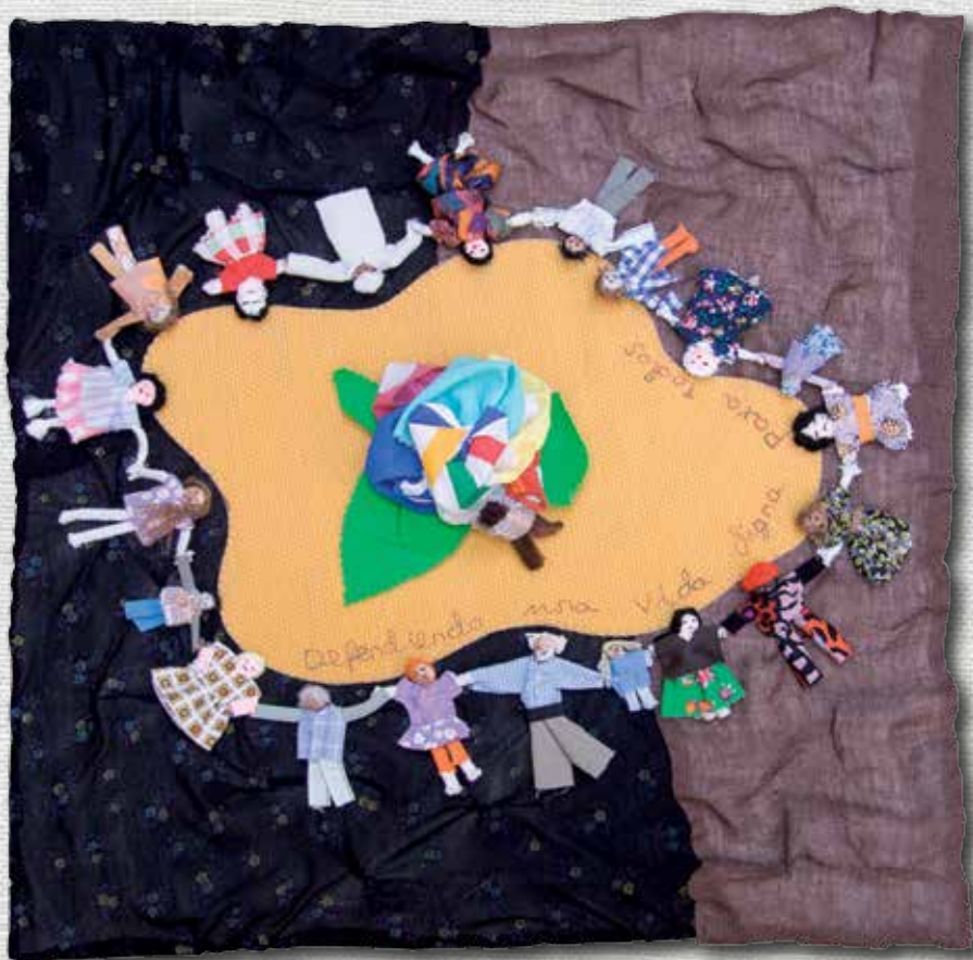
Defensem una vida digna 49 x 48 cm