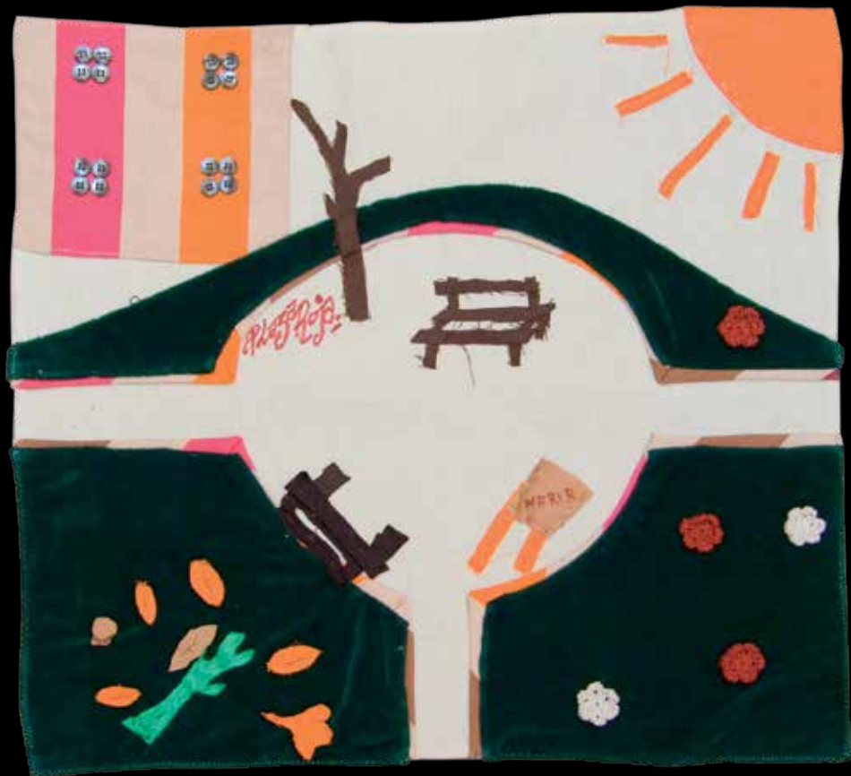
Plaça Roja II 48 x 51 cm